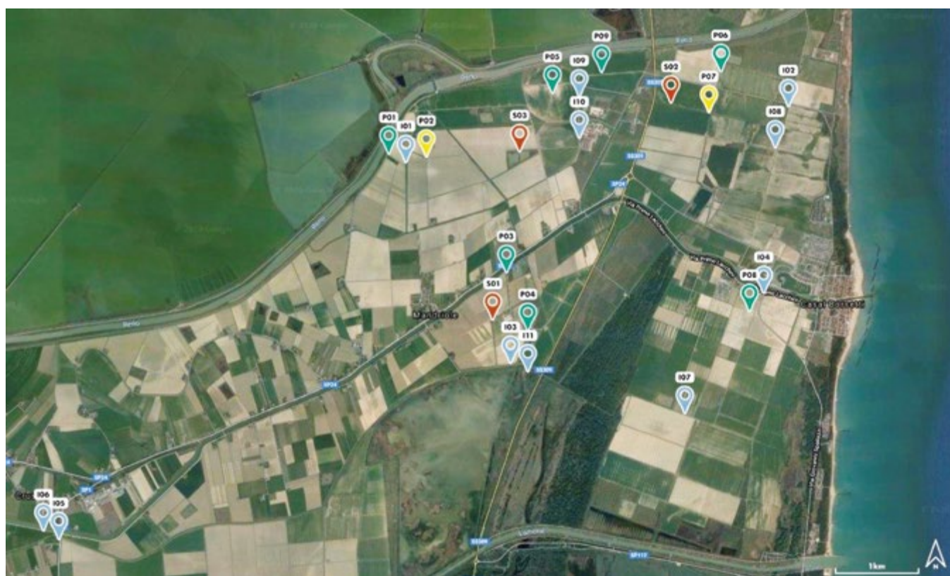
FIG. 1 RETE SENSORI

Un esempio di rete di estensione medio-grande è stato realizzato nell'ambito del progetto Life Agrowetlands II – Smart water and soil salinity management in agrowetlands (LIFE15/ENV/IT000423), finanziato dal Programma Life 2014-2020. Si tratta di una rete multifunzionale, predisposta per fornire dati meteorologici, compresi quelli necessari per il calcolo dell'evapotraspirazione potenziale (equazione di Penman-Monteith), oltre che per fornire un controllo, a scala territoriale, su parametri fisici del suolo, dell'acqua della falda freatica e dei canali.